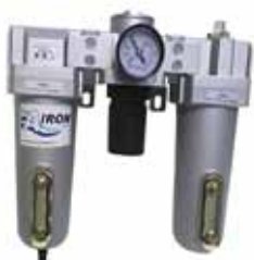
UNIDAD DE 3/4" / ATMT-3